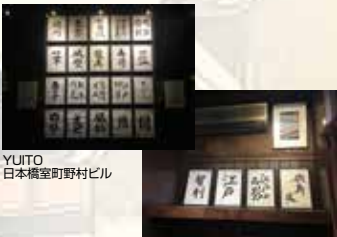
YUITO 日本橋室町野村ビル