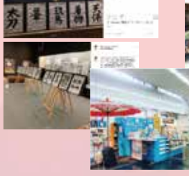
相田みつを美術館