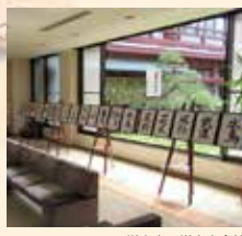
増上寺 / 増上寺会館