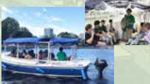
お江戸日本橋めぐり