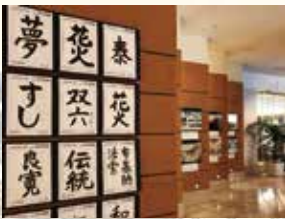
東武ホテルレバント東京