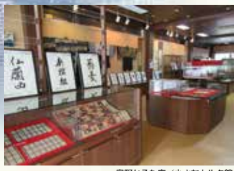
奥野かるた店 / 小さなカルタ館

◆静と動のバランスに感動しました (20代女性)。 ◆みなさんの力のこもった作品に感動しました (30代男性)。 ◆昔書道をしていたので懐かしい気持ちで見ることができました (50代女性)。 ◆江戸を感じる書道作品で良い (60代男性)。