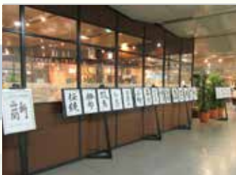
東京シティアターミナル